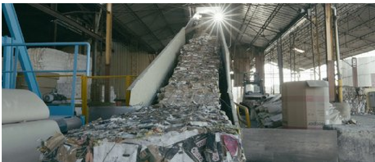
La Papeterie de Bègles de l'intérieur.