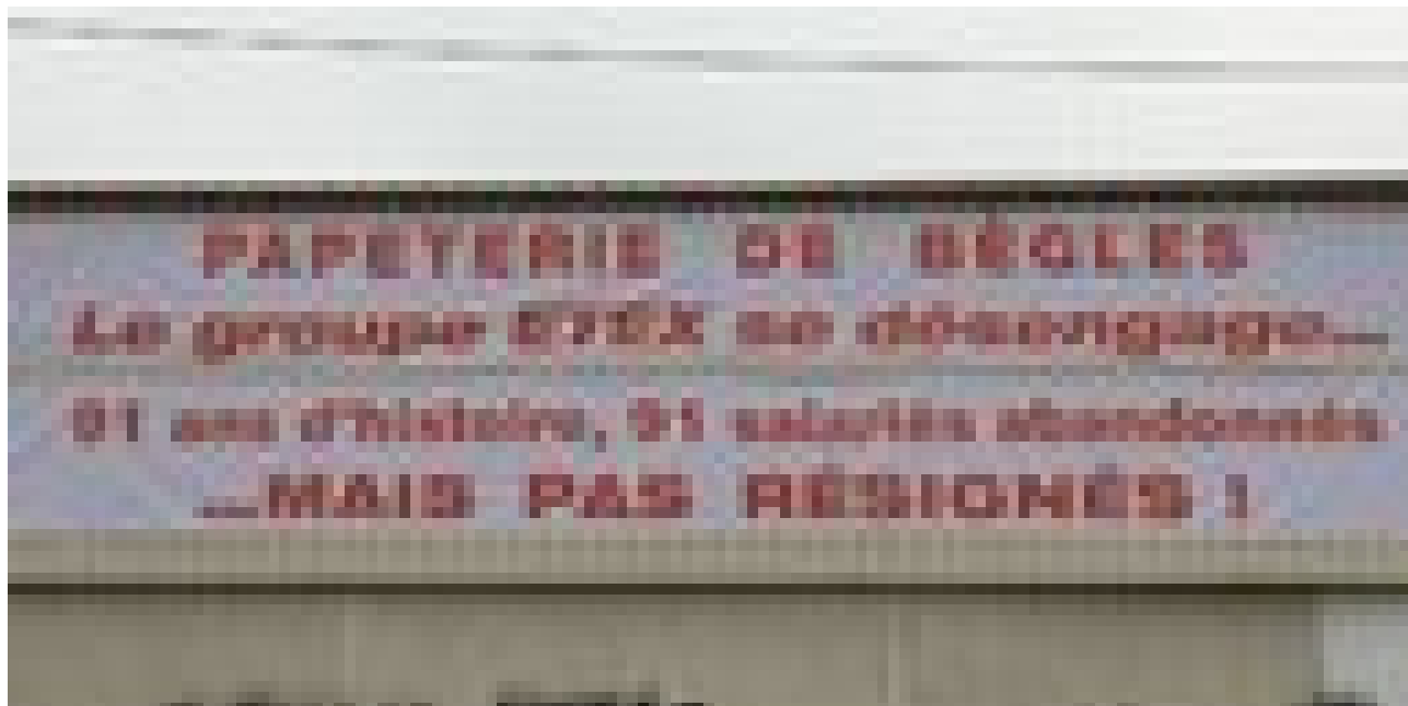
Papeterie de Bègles : deux projets de reprise, dont l'un porté pa... ( /business/industrie/2021-03-23/papeterie-de-begles-deux-projets-de-reprise-dont-l-un-porte-par-un-collectif-de-salaries-880679.html )